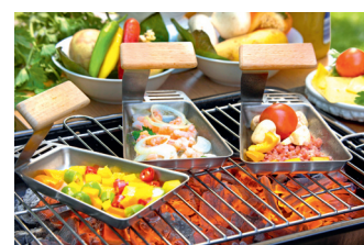
Raclette nur in der kalten Jahreszeit? Mit Grillpfännchen lässt sich der beliebte geschmolzene Käse auch in der Freiluftsaison genießen. 025 03