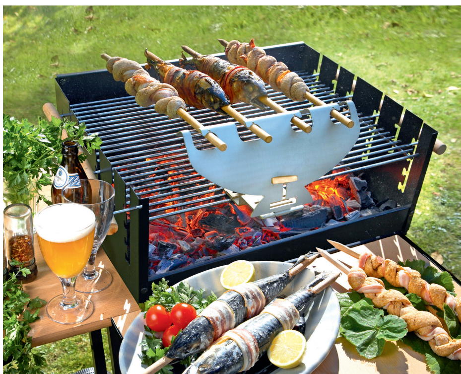
Die „Steckerlfischmanier“ ist ab jetzt nicht nur in Bayern und Österreich eine beliebte Form des Grillens. 025 01

Diese Textversion sowie zwei weitere Versionen finden Sie auf der beiliegenden CD-ROM.