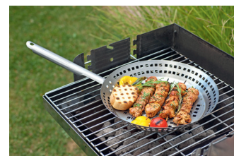
Genuss und Gesundheit müssen sich nicht im Weg stehen! Auf der Grillpfanne lassen sich knackiges Gemüse und gesunder Fisch schnell und einfach zubereiten. 025 02

Alle Texte und Bilder können kostenfrei mit Quellenangabe verwendet werden.